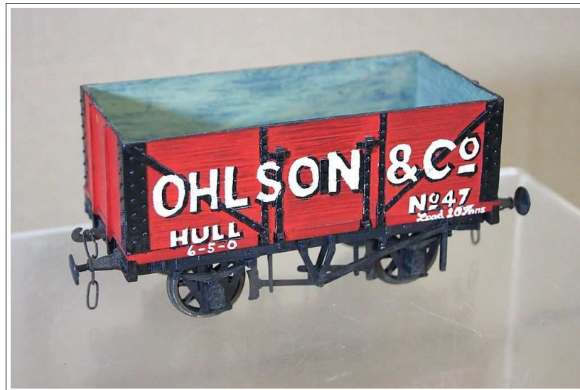
Modellvagn med Ohlson & Co Hull's logga på.